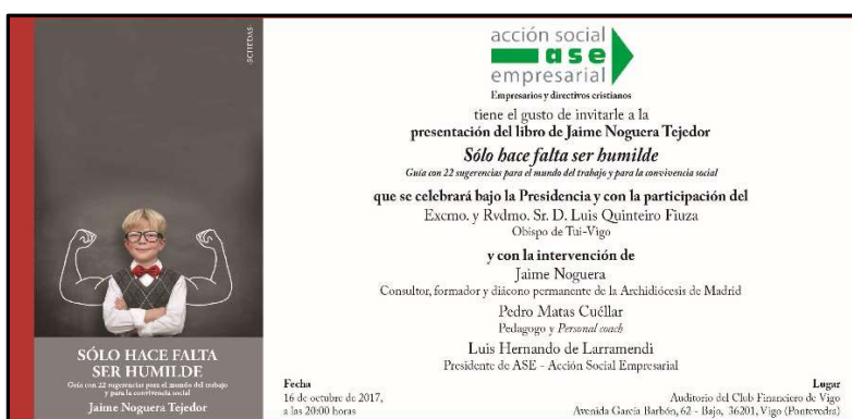
Invitación a la presentación con cubierta de libro