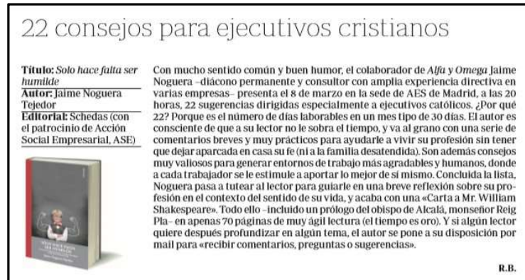
Alfa y Omega-9 de marzo de 2017