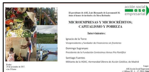
Invitación a la mesa redonda