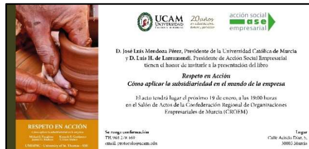
Invitación a la presentación con cubierta de libro

La UCAM (Universidad Católica de Murcia) y ASE (Acción Social Empresarial), presentaron el 19 de enero en la CROEM (Confederación Regional de Organizaciones Empresariales de Murcia), el libro “ Respeto en Acción. Cómo aplicar la subsidiariedad en el mundo de la empresa ”.