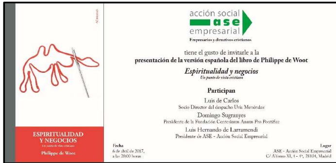
Invitación a la presentación con cubierta de libro

El 6 de abril, tuvo lugar en la sede de ASE en Madrid, la presentación de la versión en castellano del libro de Philippe de Woot “Espiritualidad y Negocios: un punto de vista cristiano”.