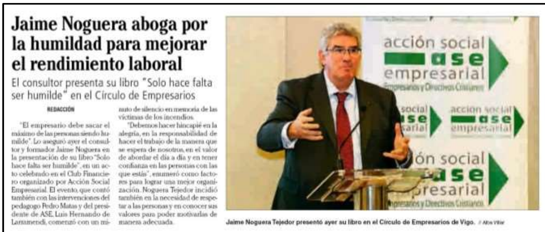
Faro de Vigo-17 de octubre de 2017

Así, algunos ejemplos son “El Faro de Vigo”, “La Voz de Galicia”, “Vigo-É”, “Alfa y Omega”, entre otros.