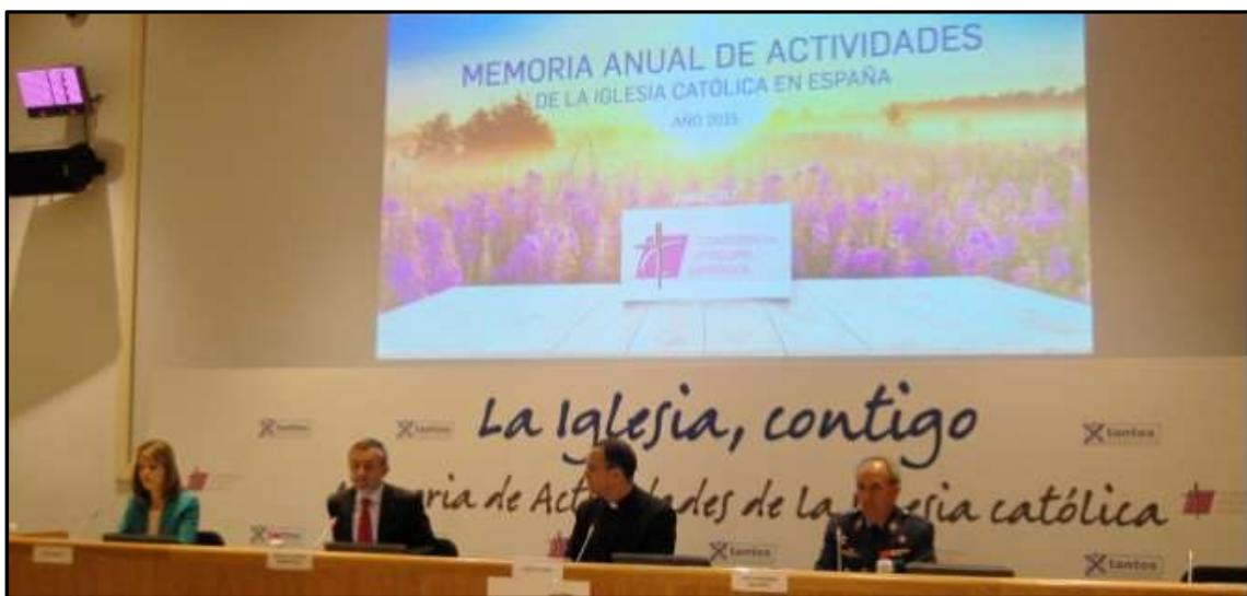
Detalle de la presentación de la Memoria Anual de las Actividades de la Iglesia 2015