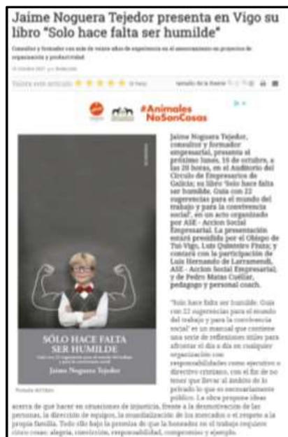
Vigo-É-13 de octubre de 2017